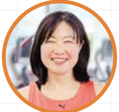
Bさん/50代 利用頻度: 週5回位